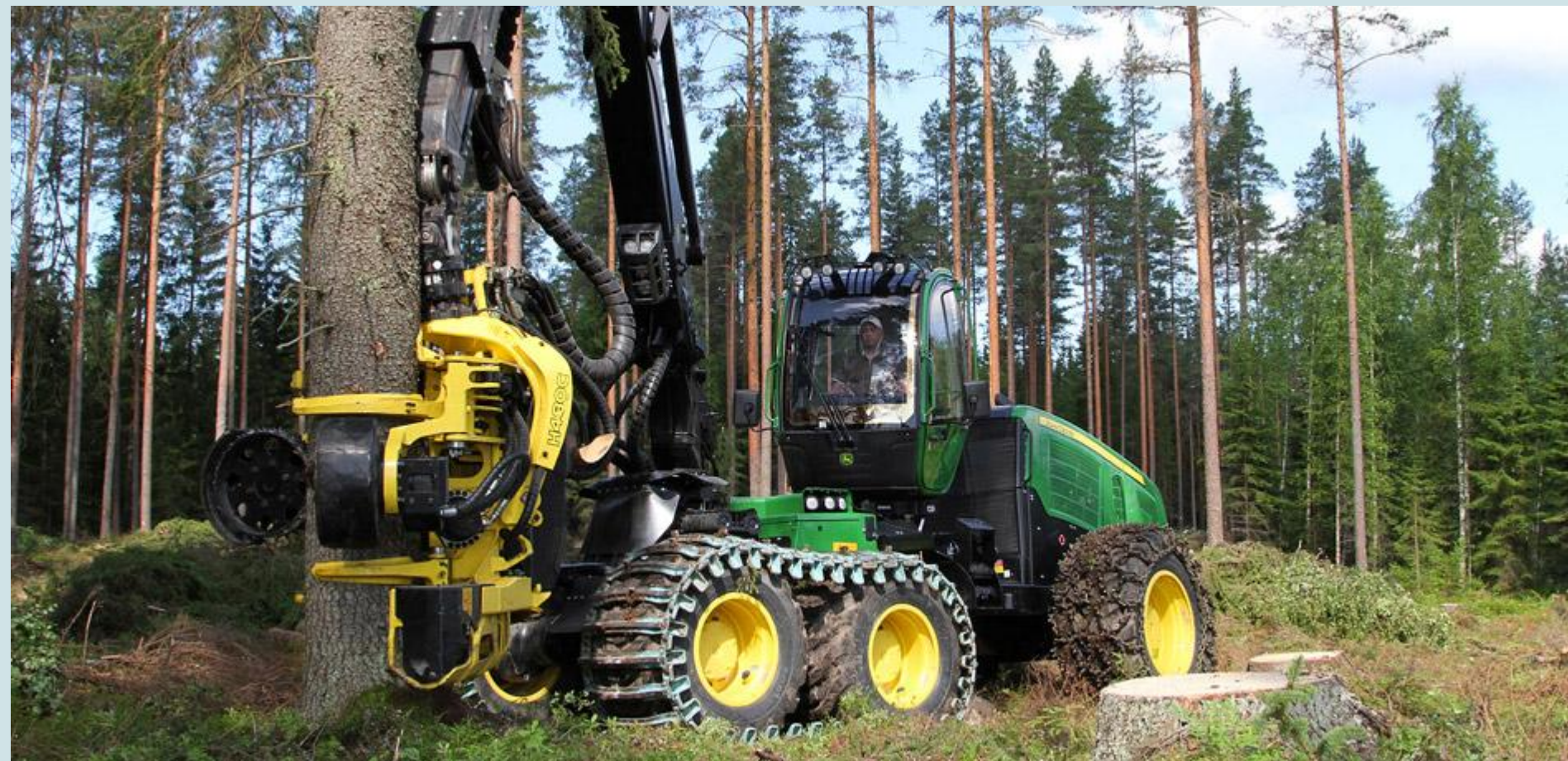
Шумски комбајн за сечу стабала (харвестер)